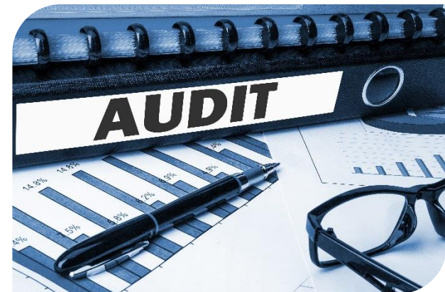
L'audit comptable sur fichier