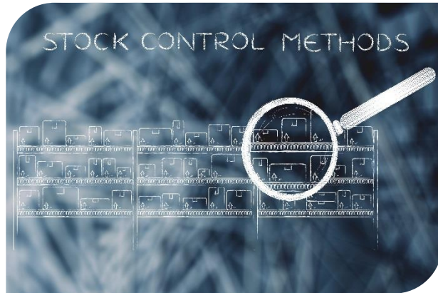
Le rapprochement avec des bases existantes