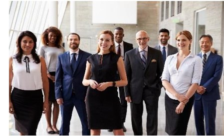
Personnel ayant la connaissance de l'historique