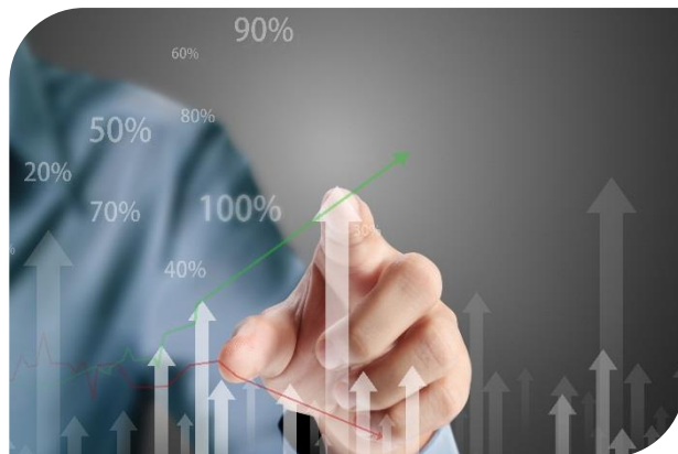
L'approche statistique par volume