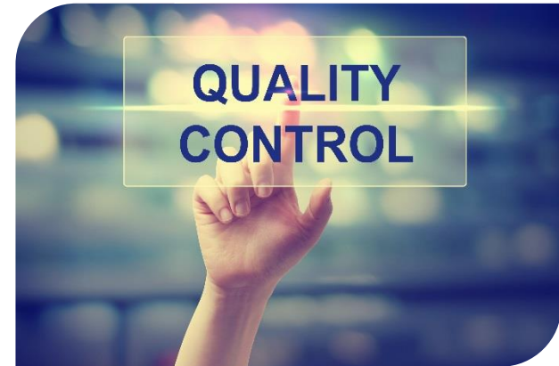
L'approche par vétusté