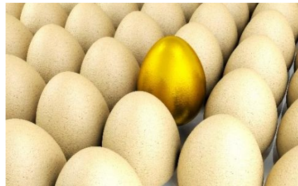
Répartition en valeur